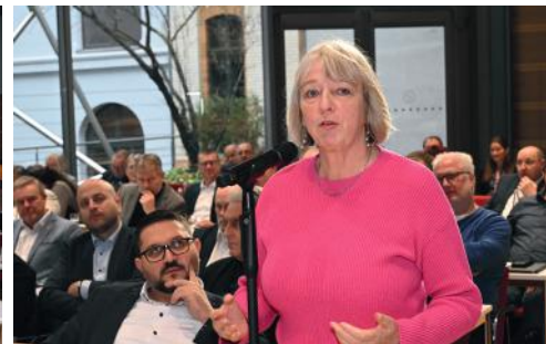
Sitzung der Bundestarifkommission am 17. November 2025