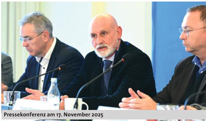
Pressekonferenz am 17. November 2025