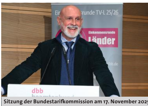
Sitzung der Bundestarifkommission am 17. November 2025